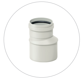
Übergangsrrohr DN 200/160 (optional) Réduction DN 200/160 (en option) Connecting pipe DN 200/160 (optional) Overgangsbuis DN 200/160 (optioneel)