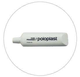
Gleitmittel Lubrifiant Lubricant Glijmiddel