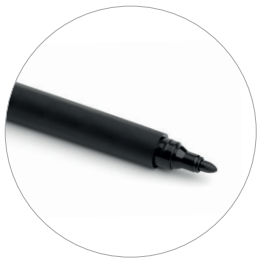
Marker Surligneur Marker Marker