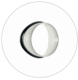
Innenflansch Bride intérieure Inner flange Binnenflens