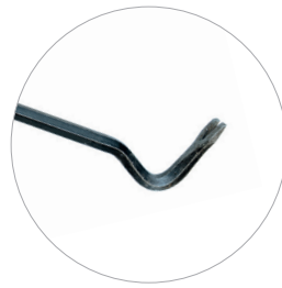
Brecheisen Pied-de-biche Crowbar Koevoet