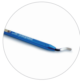
Entgrater Ébarbeur Deburrer Ontbramer