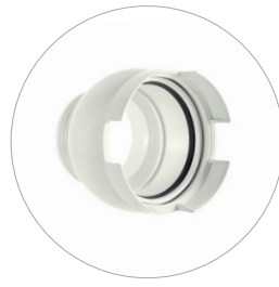
Kugel DN 200 Articulation DN 200 Ball DN 200 Kogel DN 200