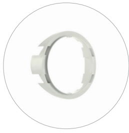
Ausgleichsring Bague de maintien Compensating ring Compensatie ring