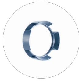
Schraubring Bague de serrage Screw ring Schroefring