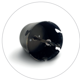
Bohrkrone DN 200 (Bohrständer optional) Scie cloche DN 200 (Support en option) Core drill bit DN 200 (Drill stand optional) Boorkroon DN 200 (Boorstandaard optioneel)